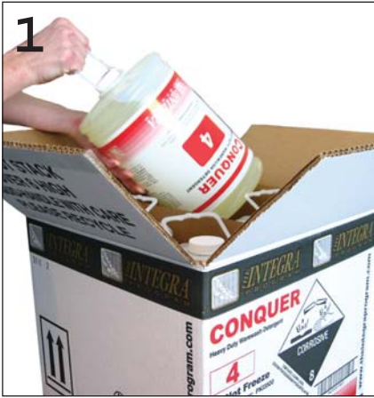
1 Remove capsule from case Sacar la cápsula de la caja Enlevez la capsule de son étui