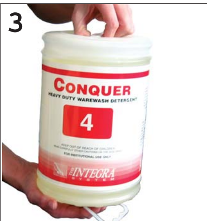
3 Grab ring and bottom handle Agarrar del aro y la manigueta inferior Agrippez l'anneau et la poignée inférieure.