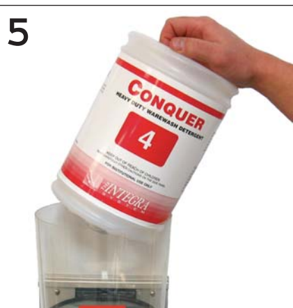
5 Remove capsule when empty Remover la cápsula cuando esté vacía Retirez la capsule lorsqu'elle est vide.

CONGRATULATIONS! You are using the safest, simplest and most accurate detergent system available today - the INTEGRA System®.