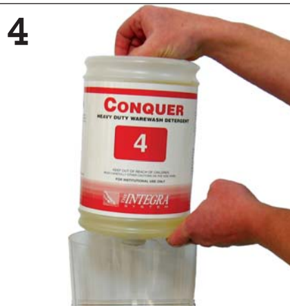
4 Insert and turn clockwise Insertar y girar en dirección al reloj Insérez et tournez dans le sens horaire.